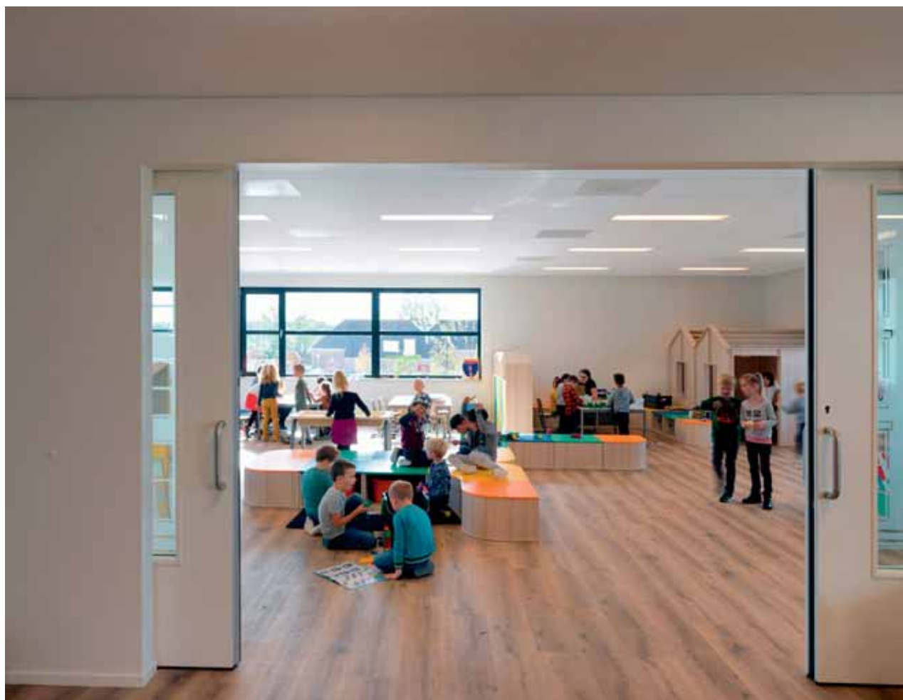
FOTO ONDER Door de toepassing van schuifdeuren kunnen lokalen bij de brede middengang worden getrokken.

FOTO RECHTSBOVEN De hier afgebeelde docentenruimte is een van de gedeelde ruimtes in het gebouw, net als het ontmoetingsplein, de aula en de bibliotheek.