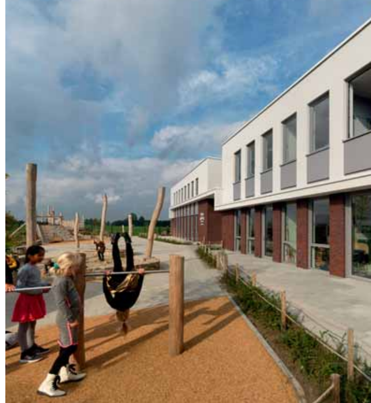
FOTO BOVEN Het terrein rondom de school is ingericht door Bureau RIS, dat hier een groot avontuurlijk speelpark heeft ontworpen.

'units'. Bij openbare basisschool Ter Tolne krijgen kinderen zowel groepsgewijs instructie als individueel les. In het ontwerp hebben we daarom een hele brede middengang opgenomen, die desgewenst door middel van schuifdeuren bij de lokalen getrokken kan worden. Voor het interieur heeft Ter Tolne zelf een interieurarchitect ingeschakeld. De Regenboogschool is een protestants christelijke school waar de kinderen klassikaal les krijgen, daar hadden ze juist behoefte aan hele grote klaslokalen." Voor De Geluksvogel golden weer andere eisen. "Dit is een school voor speciaal onderwijs, daar hebben we een prikkelarm interieur voor ontworpen met rustige kleuren." In het nieuw gebouwde deel zit Eben-Haëzer, een christelijke basisschool op gereformeerde grondslag. Deze school werkt volgens een hele duidelijke structuur, waarbij leerlingen klassikaal les krijgen. "Dit uitgangspunt hebben we vertaald naar een helder